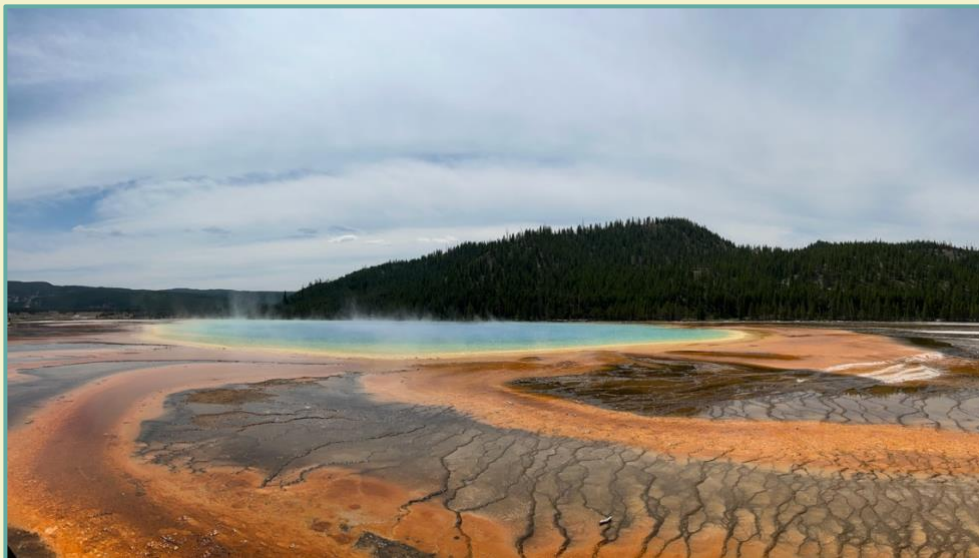
Grand Prismatic Spring, Yellowstone NP, Wyoming, Amerika

Heb je naar aanleiding van de Nieuwsbrief nog een vraag of wil je iets opmerken, stuur dan een mailtje naar directie@de-aquamarijn.nl